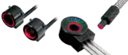
微型光纤照射头产品页面 ▶ P.153