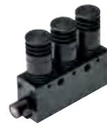
全色混合单元产品页面 ▶ P.158